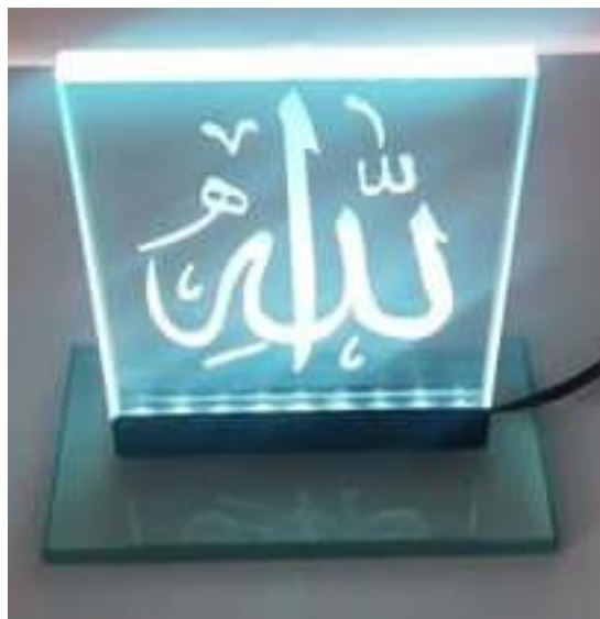
Base com iluminação de Leds

O seu uso realça e valoriza em muito os trabalhos de jateamento e vidro e espelhos.