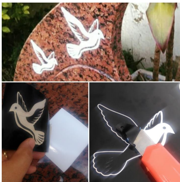
O trabalho com pintura sobre o jateado se torna bem abreviado, pois colocado a máscara sobre a superfície para o jateamento, se aproveita para a pintura também.