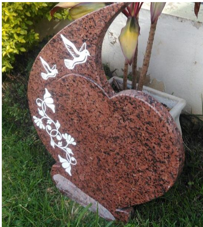
Lápide de granito jateado em baixo relevo de aproximadamente 1mm e pintado com esmalte sintético branco.