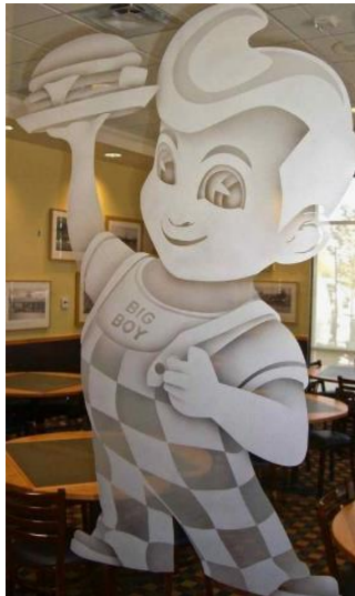
Acima exemplo de degradê no jateamento

E também um pré estudo do desenho onde será aplicado essas diferenciações de tonalidades de jateamento se faz necessário.